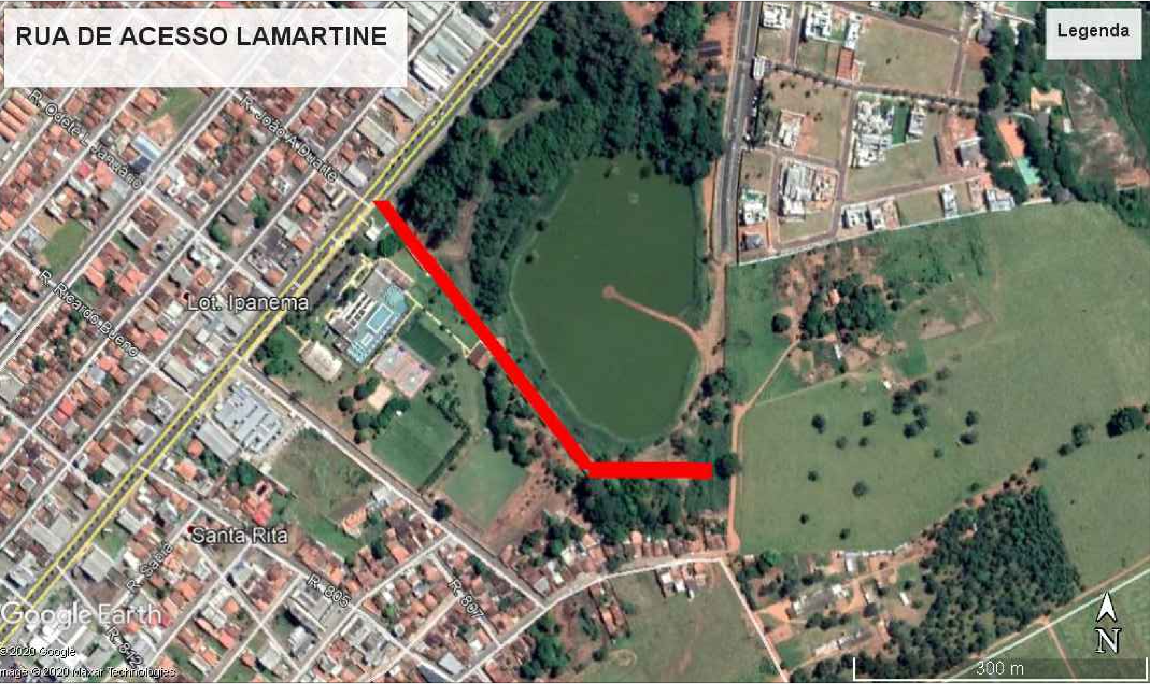
VIA LOCAL - PISTA SIMPLES CHAPADA